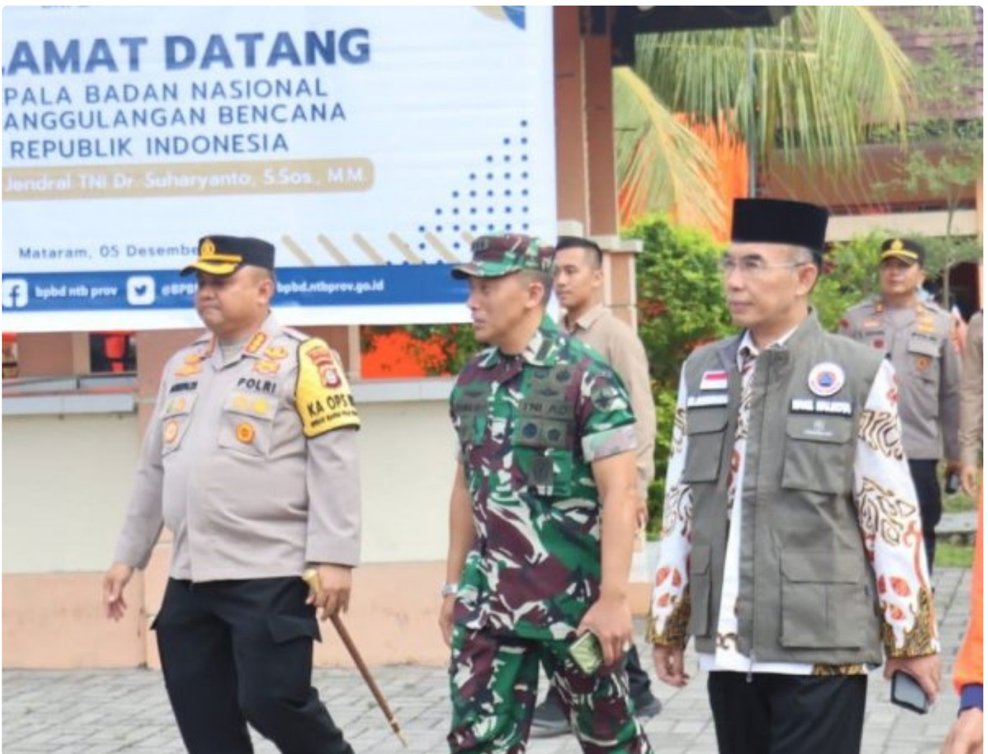
Kapolresta Mataram (Kiri) saat menghadiri acara Peletakan batu Pertama pembangunan gedung Pusdalops BPBD NTB, Kamis (05/12/2024)